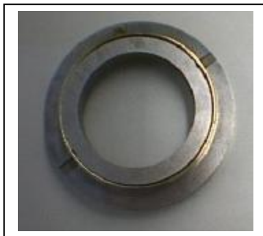
minimaler Innendurchmesser min. internal diameter