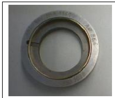
maximaler Aussendurchmesser max. of outside diameter